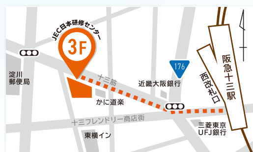
JEC日本研修センター 十三 阪急電鉄十三駅西口から徒歩3分